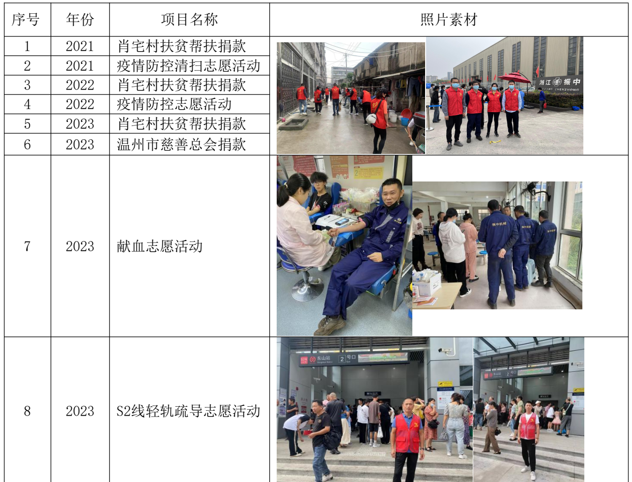
表 3 近三年公司公益事业一览表