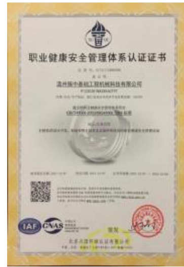
职业健康安全管理体系证书