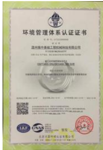
环境管理体系证书