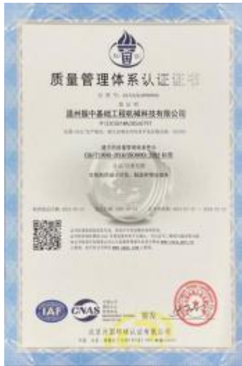
质量管理体系证书